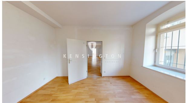
Zimmer zum Hinterhof