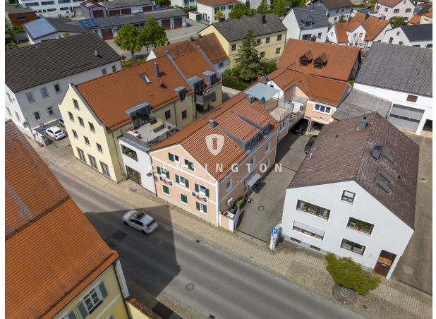
Optimal zentral gelegen!