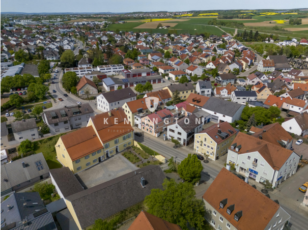
Mitten im schönen Kösching!